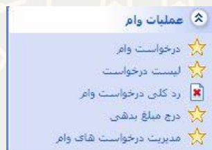
شکل ۳-۱: عملیات وام/مدیریت درخواست‌های وام

برای بررسی درخواست‌های ارسال شده، از سیستم معاونت دانشجویی، منو عملیات وام، زیر منو مدیریت درخواست‌های وام (شکل ۳-۱)، صفحه لیست درخواست‌های وام را باز کنید (شکل ۳-۱).