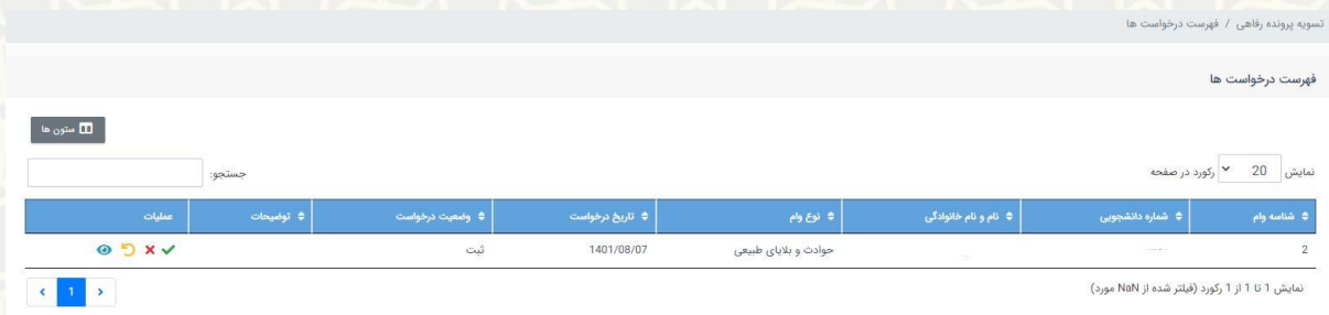
شکل ۳-۱: لیست درخواست‌های وام

در این صفحه فهرست درخواست‌های وام ارسال شده و مدارک مورد نیاز برای وام درخواستی را مشاهده می‌کنید. برای مشاهده اطلاعات دانشجویی می‌توانید نام یا شماره دانشجویی ردیف مورد نظر را انتخاب کنید. برای بررسی