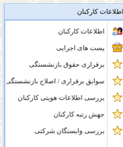
شکل 1-3: بررسی وابستگان شرکتی