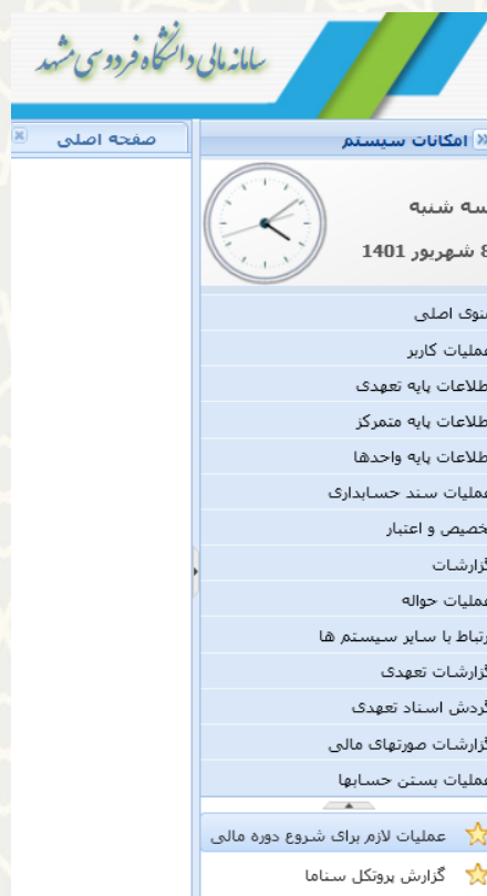
شکل ۱-۳: گزینه عملیات لازم برای شروع دوره مالی در منوی عملیات بستن حسابها در سامانه مالی

کارشناسان امور مالی، برای دسترسی به این فرایند باید در سامانه سدف و از طریق سامانه مالی، منوی عملیات بستن حسابها و گزینه عملیات لازم برای شروع دوره مالی را انتخاب نمایند (شکل ۱-۳).