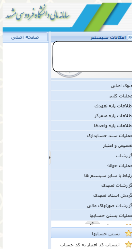
شکل ۳-۴: گزینه بستن حسابها در منوی عملیات بستن حسابها در سامانه مالی

کارشناس مالی، برای دسترسی به این فرایند باید در سامانه سدف، از طریق سامانه مالی، به منوی عملیات بستن حسابها برود و گزینه بستن حسابها را انتخاب نماید (شکل ۳-۴).