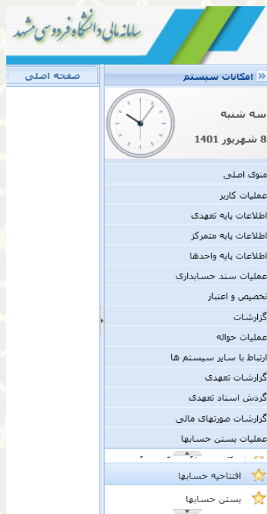
شکل ۷-۳: افتتاحیه حسابها در منوی عملیات بستن حسابها در سامانه مالی

پس از صدور سند اختتامیه، کارشناس مالی می‌تواند برای دوره مالی جدید، صدور سند افتتاحیه انجام دهند (شکل ۸-۳).