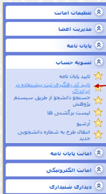
شکل ۱-۳: تایید کد رهگیری ثبت پیشنهاد در ایرانداک، فرایند الکترونیکی تسویه حساب سامانه سیماد در سدف

کارشناسان مرکز اطلاع‌رسانی و کتابخانه مرکزی بعد از ثبت پیشنهاد دانشجویان در سامانه ایرانداک باید کد رهگیری اخذشده را در سامانه سیماد نیز ثبت نمایند. برای دسترسی به امکان باید در سامانه سدف، از طریق سامانه سیماد، به منوی تسویه حساب رفته و گزینه تایید کد رهگیری ثبت پیشنهاد در ایرانداک را انتخاب نمایید (شکل ۱-۳).